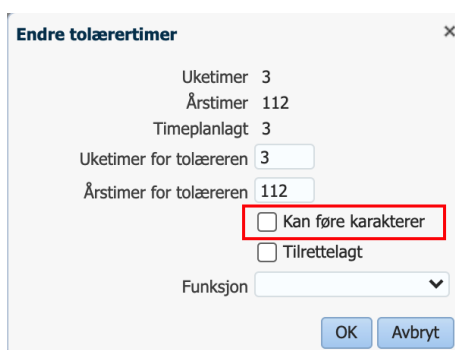
Figur 3: Marker om tolæreren skal kunne føre karakterer eller ikke.

Hvis man legger til en tolærer fra et av disse menyvalgene, kan man markere om tolæreren også skal kunne sette karakterer i faget. Man kan når som helst senere trekke tilbake denne rettigheten eller gi rettigheten til en som ikke hadde den fra før, se 3.