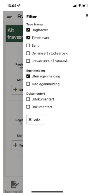
Figur 1: Eleven kan velge filterverdier for å tilpasse visningen av fravær.

Elevene kan nå filtrere visningen av eget fravær — noe som gjør det enklere å finne f.eks. timer som mangler egenmelding. Ved å trykke på ikonet for filter øverst i skjermbildet får elevene frem de ulike feltene de kan filtrere utvalgtet på, se figur 1.